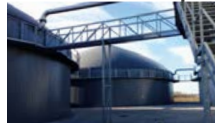
Biogasanlage in Lettland.

Dieser Tage wird der Kaufvertrag für die Biogasanlage Conatus in Lettland unterzeichnet. Wir können die bestehende Biogasanlage mit 2 MW Leistung und 750 Hektar gutes Ackerland günstig erwerben. Die Anlage ist in Betrieb, verdient täglich Geld. Die dazugehörigen Felder sind bereits bestellt. Im Sommer 2014 werden wir die Anlage noch weiter optimieren, doch schon jetzt läuft sie rund und wird ein gutes sechsstelliges Ergebnis für die Grüne Werte Energie GmbH erwirtschaften.